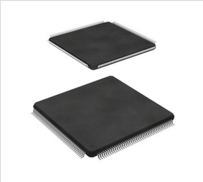
Ang imaha ay maaaring representasyon. Tingnan ang mga pagtutukoy para sa mga detalye ng produkto.